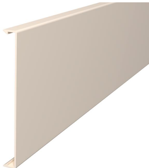
Oberteil zum Verschließen der Kanäle.